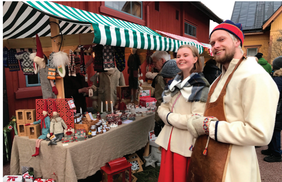
Kulla och mas på julmarknad hos Zorn

Antikt och hantverk i Gamla skolan 11-16 (Rättelse, julfika i gamla skolans café utgår). nusnas.se